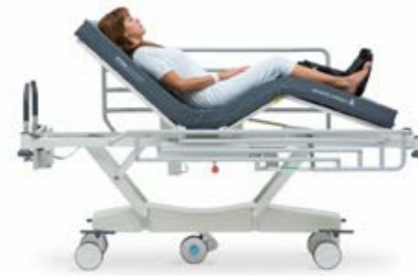
Transfer Положение «Кресло» (спинная секция: 0 – 70°)