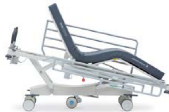
Положение АнтиТренделенбурга (13,5°) и положение «Кресло»