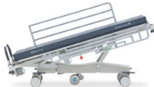
Положение Тренделенбурга (16°)