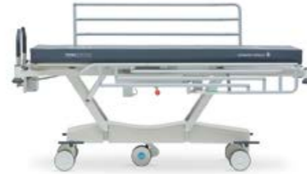
Transfer Максимальная высота (800 мм)