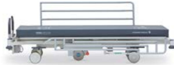
Transfer Минимальная высота (350 мм)

Возможность комбинировать положения обратного Тренделенбурга (13,5°) с позицией «Кресло» позволяет добиться удобного позиционирования пациента для нормализации его состояния.