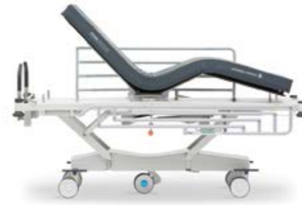
Trauma 4-х секционное ложе

Продуманный функционал конструкции позволяет сократить риск возникновения травм у медицинских специалистов и повысить уровень комфорта и самостоятельности пациента.